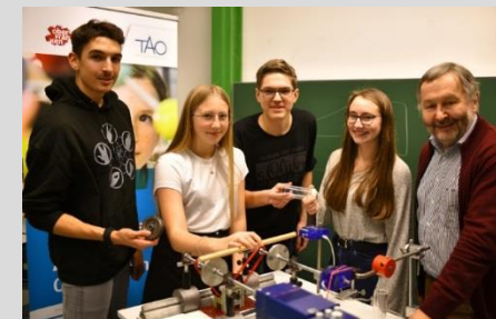
Universitäre Oberstufe (Physik) 2019/2021.