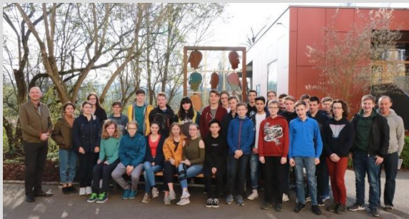
Schülerinnen und Schüler im Frühstudium 2019.

Haben Schülerinnen und Schüler die Klausur bestanden, erwerben sie einen universitären Leistungsnachweis, der während des späteren Studiums anrechenbar ist