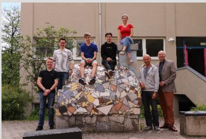
Universitäre Oberstufe 2018/2020.